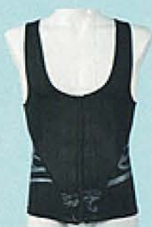
COLOR : BLACK