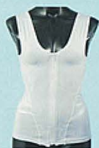
COLOR : GRAY