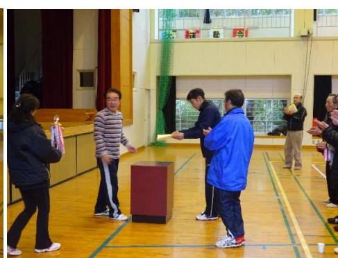
優勝チーム伊勢美山自治会