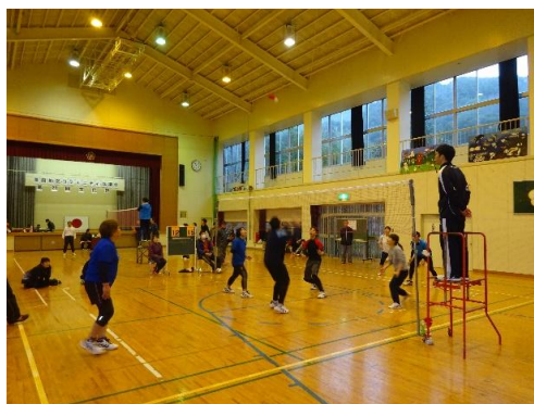
インディアカ2位決定戦