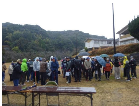
小雨の降る中開会式グラウンドゴルフ

2019年明けましておめでとうございます。今年も宜しく願い致します。皆様にとっては今年の年明けはどんな感じの年明けだったでしょうか、家族団らんで初詣に行き、お雑煮を食べて今年を語り合う又は初日の出を見に行ったとか、いろいろな過ごし方があったかと思えます。2019年も健康で楽しく明るい年であったらとおもいます。さて今年も1月20日に冬季スポーツ大会が開催されました、グラウンドゴルフとインディアカでしたがあいにくの小雨に見舞われてグラウンドゴルフが1ゲームで終了でした、プレイして頂いた皆さんは小雨が時より降る中でしたが頑張って頂き有難うございました。又インディアカは、体育館の中で熱戦が繰り広げられました。今年のグラウンドゴルフの優勝チームは、内門自治会2位が砂岳自治会3位が湯之元自治会インディアカが優勝チームは伊勢美山自治会Aチーム2位が内門自治会3位が伊勢美山Bチームでした。参加して頂いた皆さん有難うございました。夜は冬季スポーツ大会の新年会が開催されました、会長挨拶、乾杯のもと鍋料理を囲んで楽しいひと時が流れました。