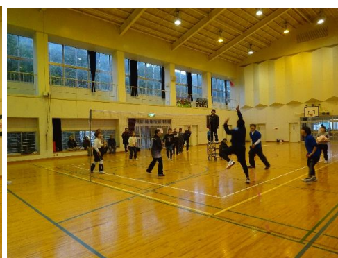
インディアカ決勝戦