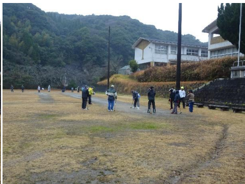
極寒の中のプレイ