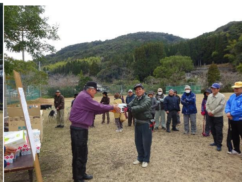
優勝チーム内門自治会表彰式