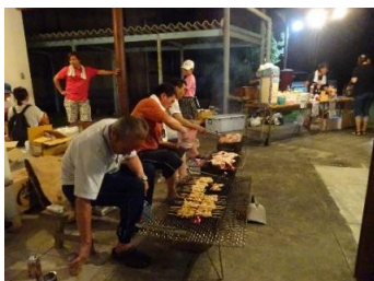
郷友会会員による焼き鳥