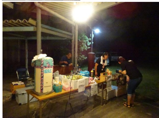
入口付近の涼風景