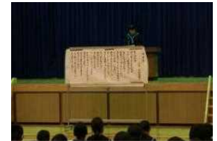
気持ちのこもった朗読