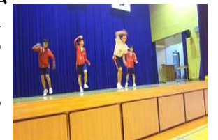
個性的なダンスを披露

どのグループも、創意工夫あふれるダンスを披露し、参観された多く先生方も、賞賛されていました。