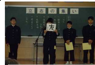
決意の言葉を発表