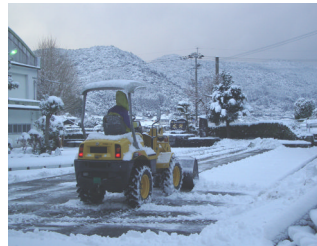
保護者による除雪作業