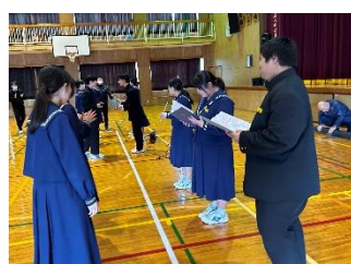
【3年生への色紙贈呈】