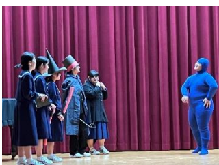
【3年生のサプライズ劇】