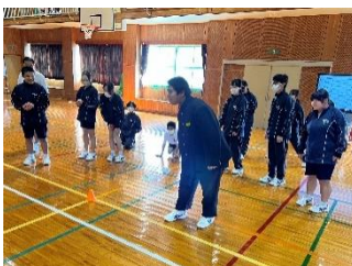
【クラスマッチの様子】